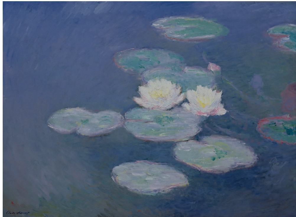
Claude Monet, Nymphéas, effet du soir , 1897

www.academiedesbeauxarts.fr/appe-candidatures-residence-villa-hegra-academie-des-beaux-arts